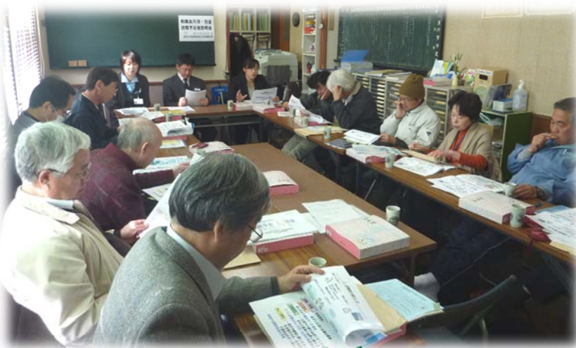
2/21 (火) 教職員共済、労金等 退職予定者説明会 (浜松)