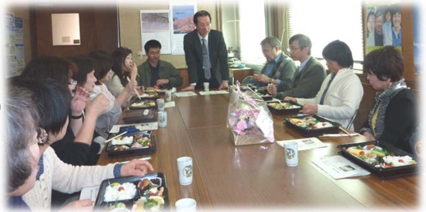
3/19 (月) 女性部昼食会 (静岡)